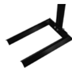
Pied Autocal A installer sous une roue de véhicule