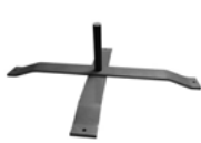
Croix grise métal 12Kg - 85x70cm