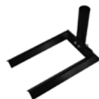
Pied Autocal A installer sous une roue de véhicule