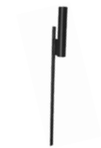
Piquet acier 60cm Terre, neige, sable...