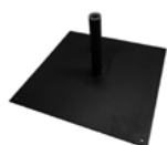
Platine noire 6Kg - 40x40cm