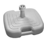
Pied parasol blanc 17L - 43x43cm